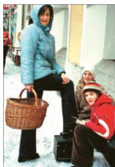
Ungewohnte Straßenszene in Großarl.

Die Großarler Hauptschüler machten an diesem Vormittag mit den „Kunden“, aber auch mit sich selbst die unterschiedlichsten Erfahrungen. „Ich habe gemerkt, dass es nicht so einfach ist, auf diese Weise Geld zu verdienen, denn nicht alle Leute sind nett. Am An-