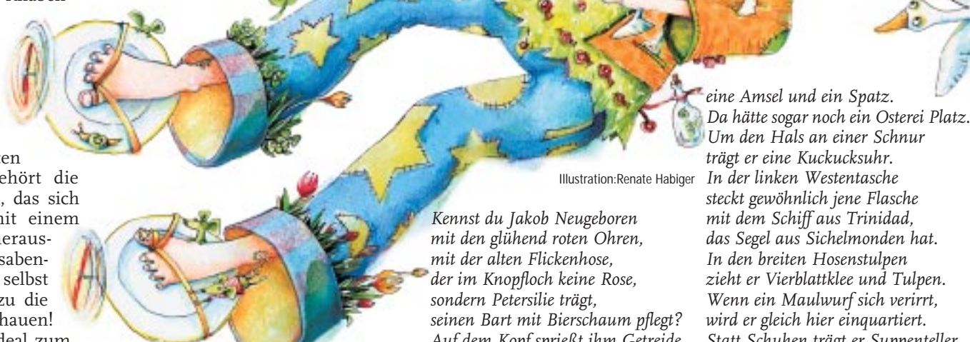
Illustration: Renate Habinger

Menschen kommen darin auch vor, hauptsächlich zwischen den Zeilen. Einer wird ganz groß vorgestellt. Es ist Jakob Neugeboren, und ihr bekommt ihn als Ostergeschenk hier abgedruckt. Seine Beschreibung könnt ihr auf der Seite rechts unten nachlesen. tkh